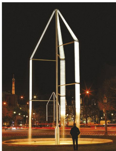
En haut Alcova, 2018, verre coulé ©CLAIRE LAVABRE.

Depuis le système de bureau pour le « coworking » Joyn (2002) et le concept d'« espace dans l'espace » de l' Alcove Sofa (2006) pour Vitra, les fondateurs du studio parisien renouvellent les typologies d'objets. « L'empathie est la chose la plus importante dans le design, mais avoir aussi une certaine distance permet de trouver des solutions nouvelles, de réfléchir à de nou-